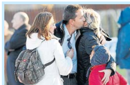
ALBERTO MARTÍN / EFE